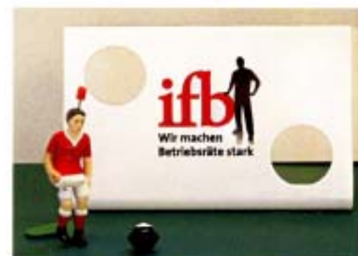
アクリルボードへのロゴ、文字印刷 既製の標準キッカーとの組み合わせ