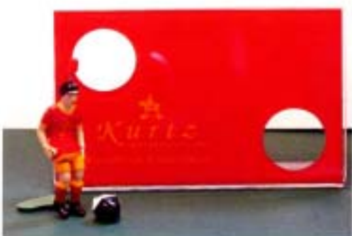
アクリルボードへのロゴ、文字印刷