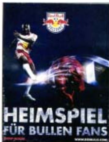
「レッドブル」 ノベルティグッズとして採用（ボックス仕様）