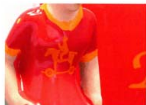
キッカーのオリジナル塗装 キッカーの胸部分にオリジナルのロゴ印刷