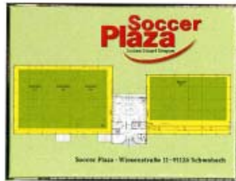
「ドイツ サッカープラザ」 ノベルティグッズとして採用（ボックス仕様）