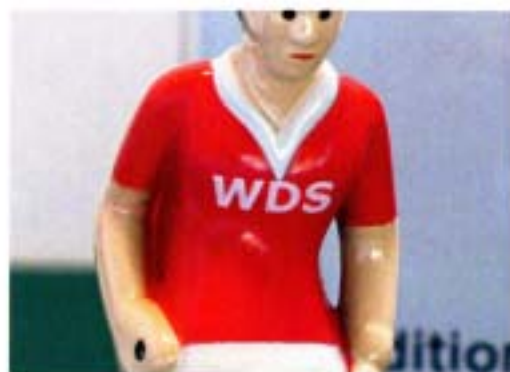
キッカー胸部分への文字印刷