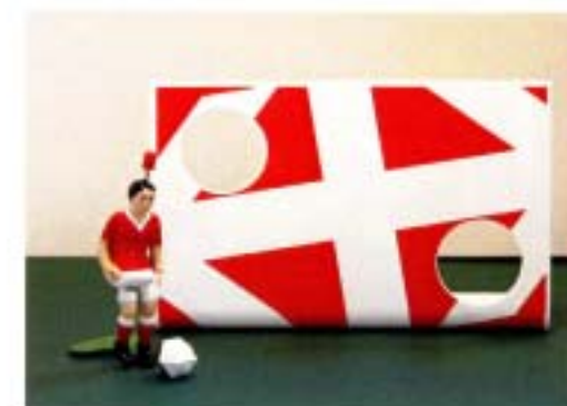
アクリルボードのオリジナル印刷 既製の標準キッカーとの組み合わせ