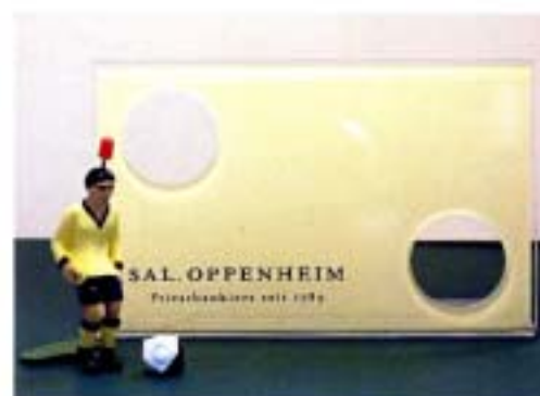
アクリルボードへのロゴ、文字印刷 キッカーのオリジナル塗装