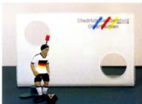
アクリルボードへのロゴ、文字印刷 既製のドイツ代表キッカーとの組み合わせ