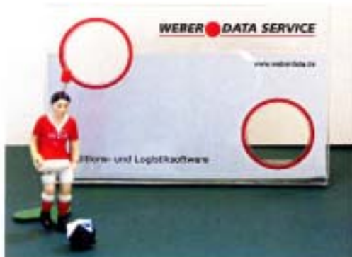
アクリルボードへのロゴ、文字印刷